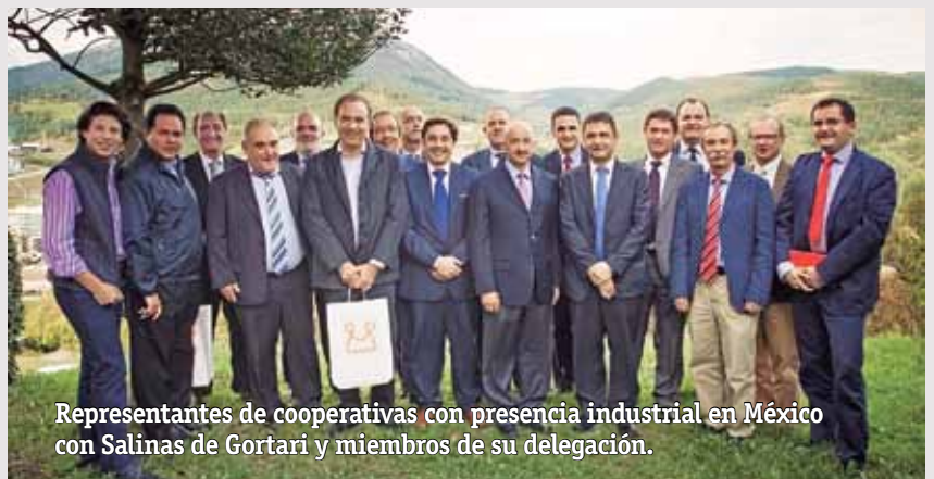
Representantes de cooperativas con presencia industrial en México con Salinas de Gortari y miembros de su delegación.

Más que un consejo, me gustaría constatar que MONDRAGON cuenta en México con más de 10 empresas participando en la industria automotriz, en las actividades agrícolas, académicas... Esto muestra que son caminos varios y diversos, pero hay muchos pasos para la complementariedad, tanto para las empresas vascas en el mercado de América del Norte con México como socio, o para México para participar en el mercado europeo a través de esta experiencia.