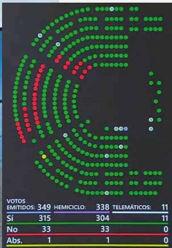
Resultado de la votación para convalidar el RDL 1/2025 que ratifica la singularidad del modelo LagunAro.